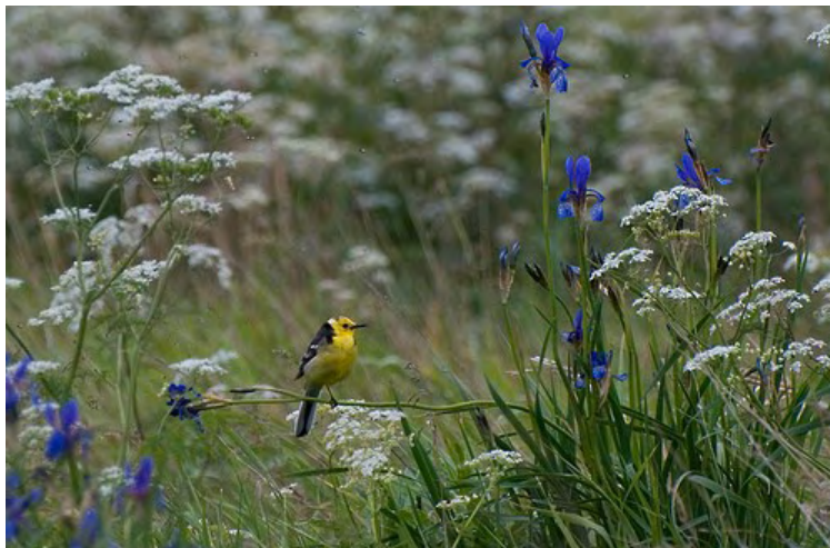
Citron vipstjert han og sibiriske iriser