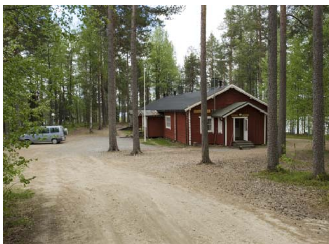
Hytten vi boede i

50 km fra hytten mod nord ligger 2 skjul i en lille skovlysning, hvor der er plads til 2 personer i hvert skjul. Her er der også stor chance for jærv og bjørn.