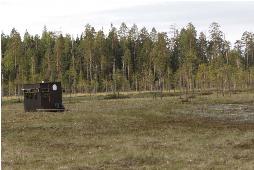
Et af skjulene i ingenmandsland