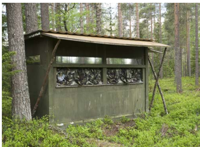
Et typisk skjul

De fleste nætter kom bjørn og ulv først, når solen var gået ned omkring kl. 22.00, og de sidste blev set, inden det blev rigtigt lyst igen ved 4-tiden. Jærvnen derimod kan komme hele natten, og den sidste jærv, vi så, kom først kl. 5. Hvis der er bjørne i området, kommer jærvnen som regel ikke frem.