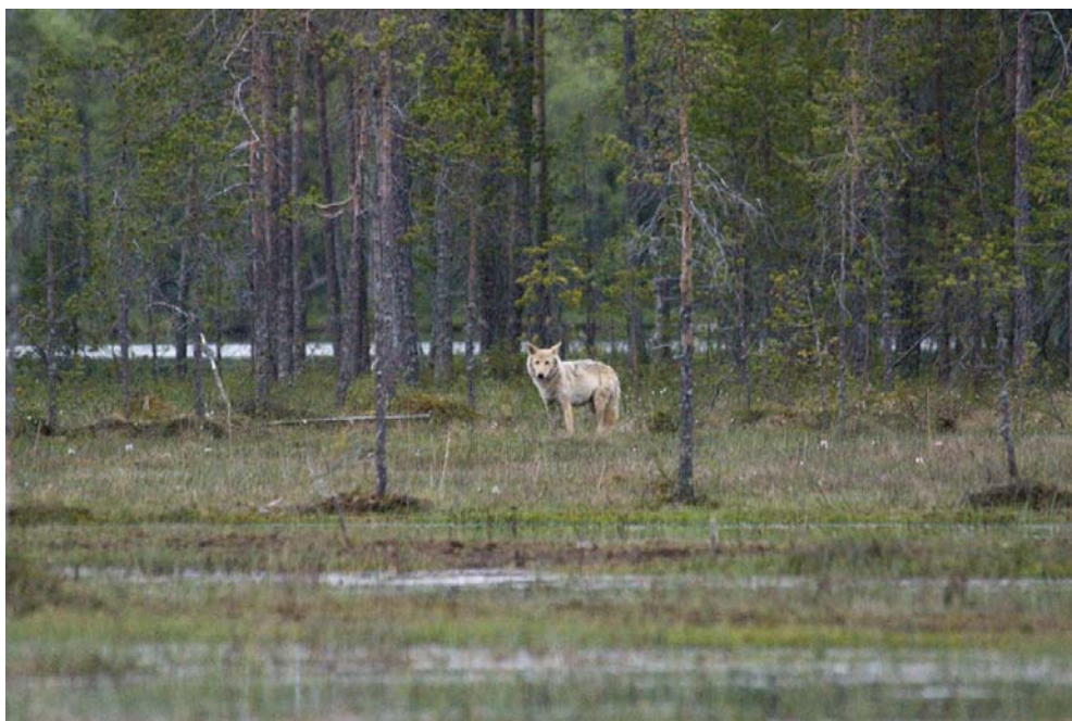
En af de 3 ulve vi så.