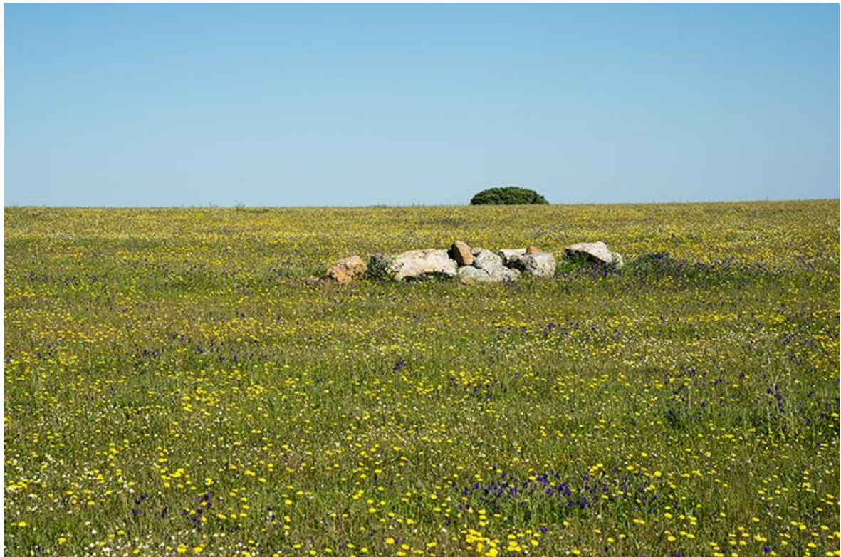
Steppen i fuldt flor

Kulturen er i særklasse! Vi vil opleve gamle byer som Cáceres og Trujillo, der begge gemmer på historier om en svunden tid: Cáceres med det gamle middelaldercentrum og Trujillo med den smukke borg og hvorfra byens sønner var med til at "opdage" Sydamerika!