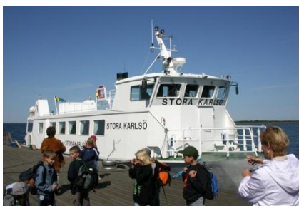
Båden til St. Karlsö

Nordpå ligger Fårö, som tidligere var forbudt område for ikke-svenske statsborgere, men i dag er der ikke nogen problemer. Det var her Ingmar Bergman boede, og Olof Palme havde sommerhus. Nogle af Gotlands største og smukkeste rauker står idyllisk i strandkanten. Langs de stenede strande finder vi mange ynglefugle som havterne, dværgterne, stenvender og rødben. På vej tilbage fra Fårö besøger vi et kystområde, hvor vi har store chancer for den spitzels gøgeurt, som i Nordeuropa kun findes på Gotland.