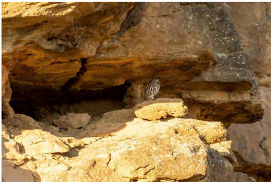
Kirkeugle. Castillo de Montearagón.