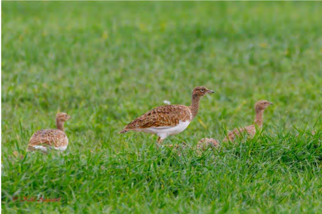
Dværgtrapper. Linyola ved Lleida.