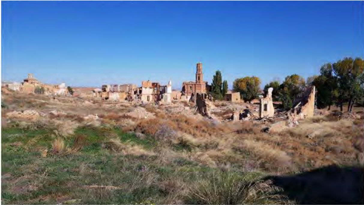
Ruinerne af den gamle bydel i Belchite, bombet under den spanske borgerkrig.

En Blådressel fløj fredeligt rundt mellem ruinerne, uvidende om fortidens rædsler.