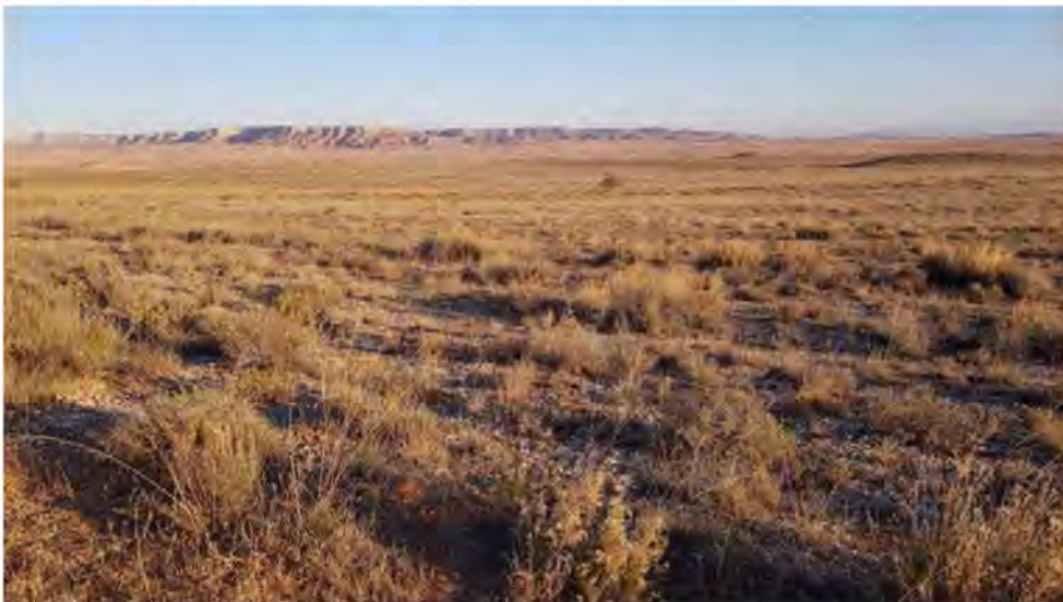
Steppeområdet El Planeron ved Belchite. Habitat for Duponts Lærke.

Det blev en betagende morgen ude i det helt stille, store landskab, som mest mindede om noget fra en westernfilm fra Arizona i USA. Karrig busksteppe milevidt med lave, rødlige bjerge i horisonten. Her var småflokke af Dværglærker , Kalanderlærker , overvintrende Sanglærker samt Theklalærker , Toplærker og Rødhøns . Endvidere den karakteristiske steppefugl Sydlig Stor Tornskade som kun sås her på turen. Et par Blå Kærhøge og en Kongeørn afsøgte terrænet i den gyldne, skrå morgensol.