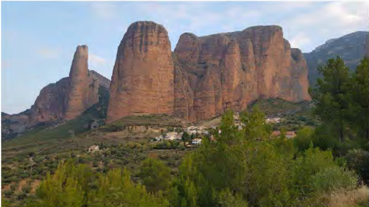
Mallos de Riglos.

Mallos de Riglos er et imponerende sted med høje, rødbrune klippesøjler og lodrette klippevægge, dannet af konglomeratklippeformationer, beliggende oven for en lille bjerglandsby. Det er et yndet sted for rapellere og bjergbestigere fra hele Spanien.