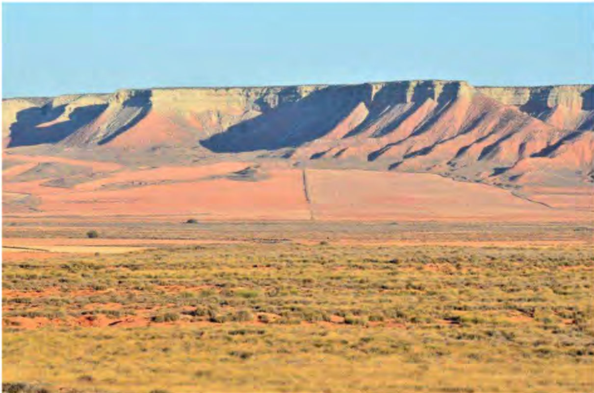
El Planeron tidlig morgen, med de røde bjerge i baggrunden.

Med solen højere på himlen blev det varmere, op til 20 grader. De allestedsnærværende Gåsegribbe og Røde Glenter kom på vingerne i termikken. Vi nød vores medbragte frokostpakker i disse smukke omgivelser.