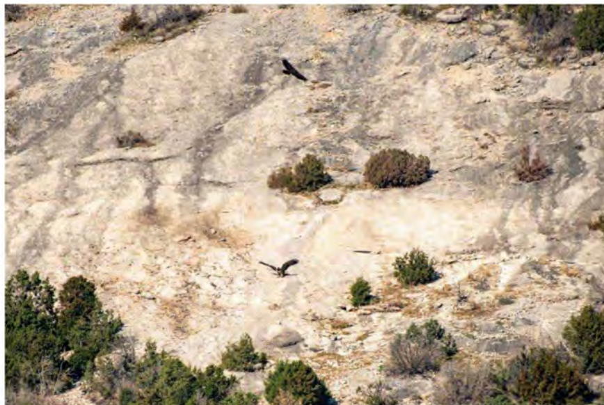
Lammegribbe ved fodringsplads. Santa Cilia.