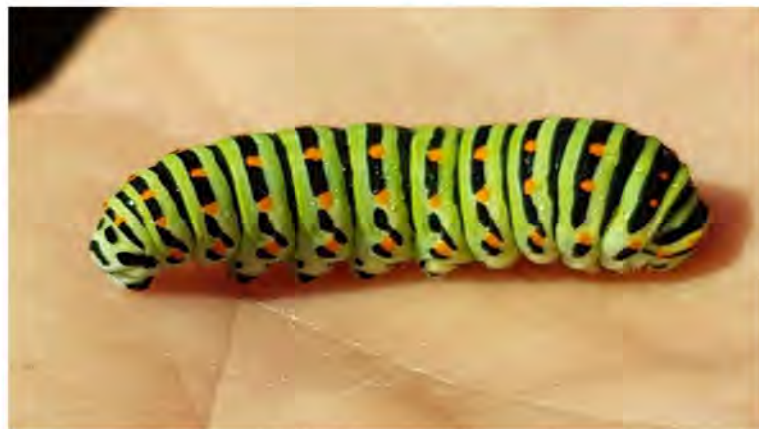
Larve af Svalehale. Bierges.