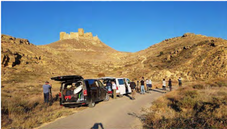
Udsigt til borgen Castillo de Montearagón.

Andet stop, sidst på eftermiddagen, var en flot borg oppe i de første højdedrag i bjergene – Castillo de Montearagón, nær Huesca. Vi gjorde holdt en times tid ved foden af borgklippen og spejdede efter gode fugle i det smukke klippeterræn. En herlig Kirkeugle gemte sig i en klippesprække og kom senere ud at sidde frit fremme i aftensolen. En populær, lille ugle blandt deltagerne. ”Vad gullig den är”, udbrød en af de svenske deltagere, og nuttet så den bestemt ud. Stedet bød også på en Sørgestenpikker , som er en svær art at se i denne del af Spanien. Den holdt mest til på nogle høje skråninger, hvor den var vanskelig at se, men alle deltagere fik dog til sidst set den tydeligt i teleskop, siddende på klippeblokke i aftensolen.