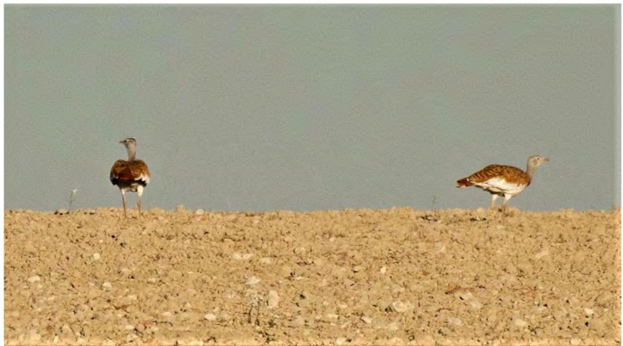
Stortrapper ved Bujaraloz.

Lyset begyndte at svinde, og vi skulle begive os den lange vej tilbage til vores hotel i Lécera. Men forinden stoppede vi ved et nærliggende, tørt område ved en svinefarm. Her fandt vi højst overras-