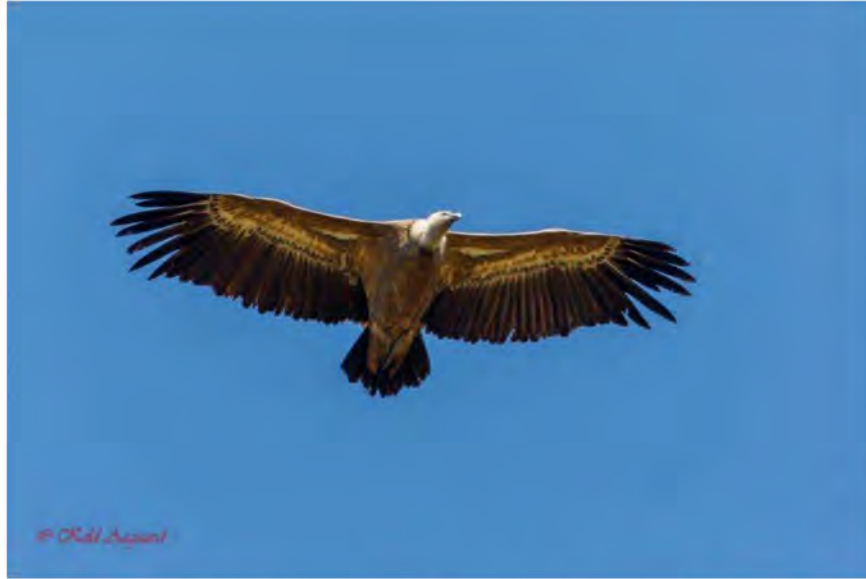
Gåsegrib ved kolonien i Vadiello.

Blandt Gåsegribbene kredsede højt oppe en Vandrefalk og to Alpekrager . Og de mange Klippeduer så for en gangs skyld ud som ægte Klippeduer . En udfarvet Lammegrib svævede pludseligt over hovedet på os, blandt Gåsegribbene . En af fuglene fra et lokalt ynglepar.