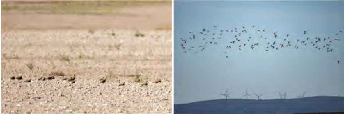
Spidshalede Sandhøns på en kalkbakke ved Belchite.

Eftermiddagsprogrammet blev at køre i 1½ time til et stort landbrugsområde øst for Zaragoza, som er et kendt sted for den truede Stortræppe . Undervejs krydsede vi Ebro-floden, som er en af Spaniens store floder. I det generelt meget tørkeprægede landskab her i Aragonien var Ebro-dalen en grøn oase langs floden. De mange storkereder på næsten hver en højspændingsmast vidnede om et rigt storkeliv her om sommeren.