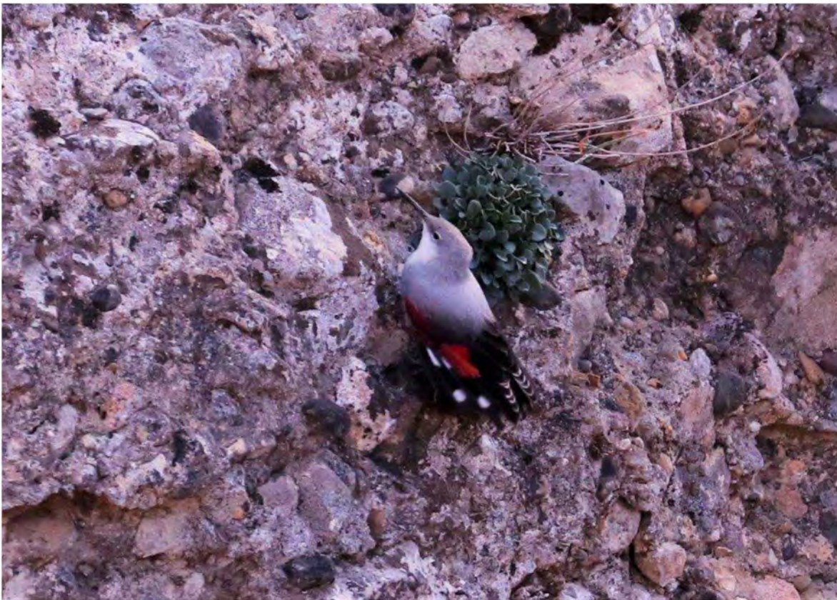
Murløber. Vadiello.