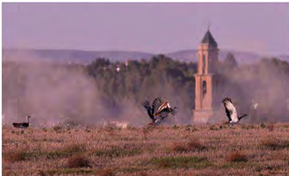
Stortræpper letter, Bujaraloz.

Vi nåede frem til det store landbrugsområde ved Bujaraloz, som mest bestod af kunstvandede majsmarker og græsmarker. Der var fuld aktivitet af landbrugsmaskiner alle vegne og derfor megen forstyrrelse. Stortræpperne lod sig heller ikke finde trods ihærdig eftersøgning. Overalt sad der Musvåger , og mange Rørhøge og Røde Glenter sås i luften. Vi stødte på to cyklister, som spurgte os, om vi ledte efter "Great Bustards". Det kunne vi jo bekræfte, og så forklarede de hvor de havde set en flok tidligere på dagen. Afsted til området med det samme. Det var et tørt, stort steppeområde med mere naturlig vegetation. Pludselig så vi syv, flotte Stortræpper lette nær bilerne og lande igen, ikke langt fra os. Stor var glæden! Vi kunne nyde dem en god stund, inden de gik langsomt og majestætisk bort for at forsvinde over bakkerne.