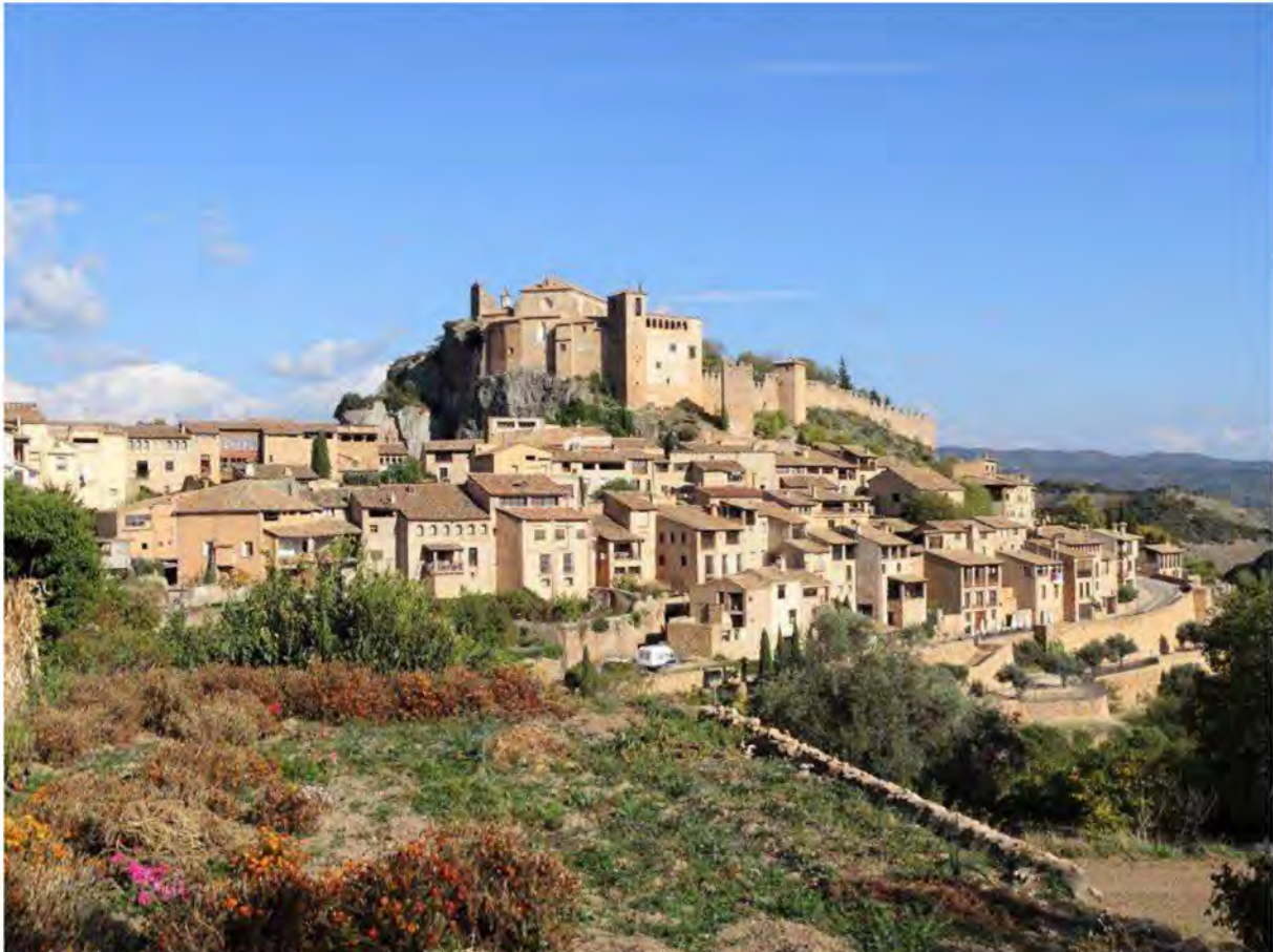
Middelalderbyen Alquézar.

Dagens sidste destination var en gammel middelalderlandsby i bjergene, Alquézar. Byen er genopbygget og restaureret, så den nu fremstår som en autentisk og genskabt bjergby med en flot kirkeborg øverst. Alquézar er et yndet turistmål, så der var liv og mange mennesker på cafeerne og i de brolagte stræder og smalle gyder. Efter en kop kaffe i det varme solskinsvejr nød vi også at gå rundt i denne smukke by. På en klippeflade ved siden af kirkeborgen fandt Jaume en Murløber . To par Alpekrager legede i luften, og landede på borgen. En flot, udfarvet Lammegrib med en knogle i kløerne gled over sammen med Røde Glenter og Gåsegribbe .