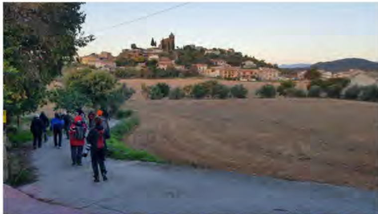
Morgenvandretur ved landsbyen Bierges.

Efter morgenmaden gik vi på vandretur i landbrugsområdet ved landsbyen. Gennem olivenlunde og langs gamle stendiger, til levende hegn og små marker. Her var rigtig landlig stemning, og det vrimlede med fugle. Mest småflokke af Sangdrobler og Bogfinker , men også Gulirisker , Engpibere , Grønsiskener , Kernebidere , Rødhalse , Bomlærker og Husrødstjerter . En Stenspurv i toppen af et træ viste sig fint frem i morgenlyset. Morgenturens bedste fugl var en syngende Gærdeværling , på sangpost i et oliventræ. En smuk larve af Svalehalesommerfugl blev fundet på en skærmpilte, og vi så et Spansk Murfirben kravle på et stendige.