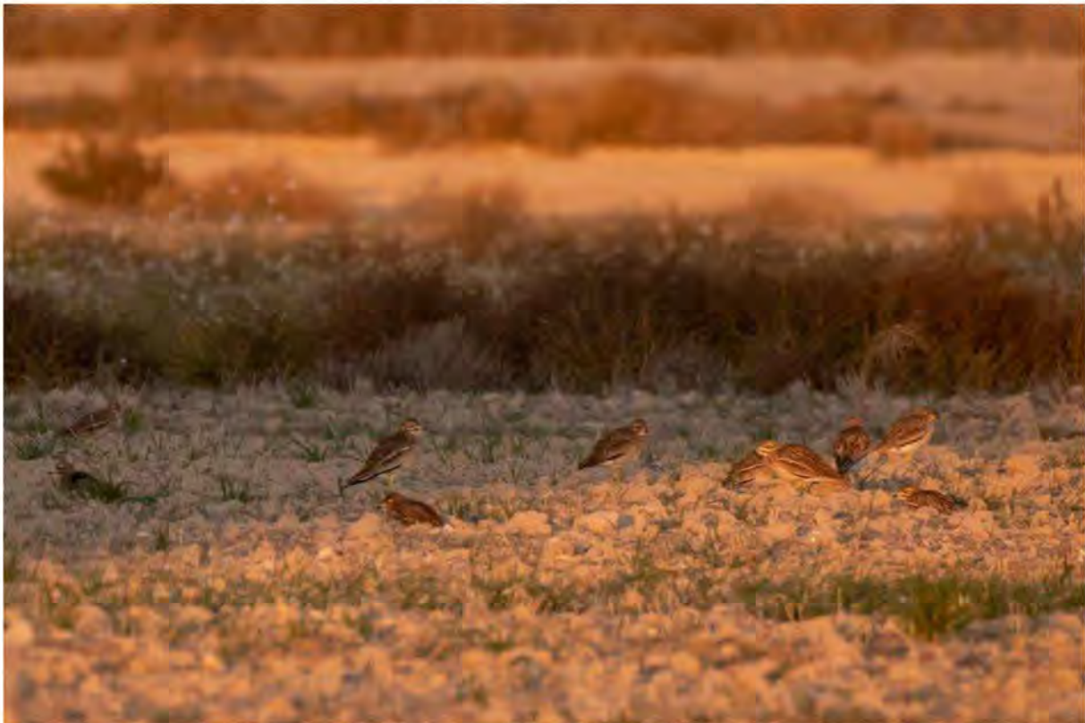
Trieler ved aftenstide. Udsnit af flok på over 150 fugle. Bujaraloz

kende en flok på mindst 150 Trieler stående sammen på en mark. I den sidste aftensol kunne vi nyde disse mærkelige fugle, med deres store, gule øjne.