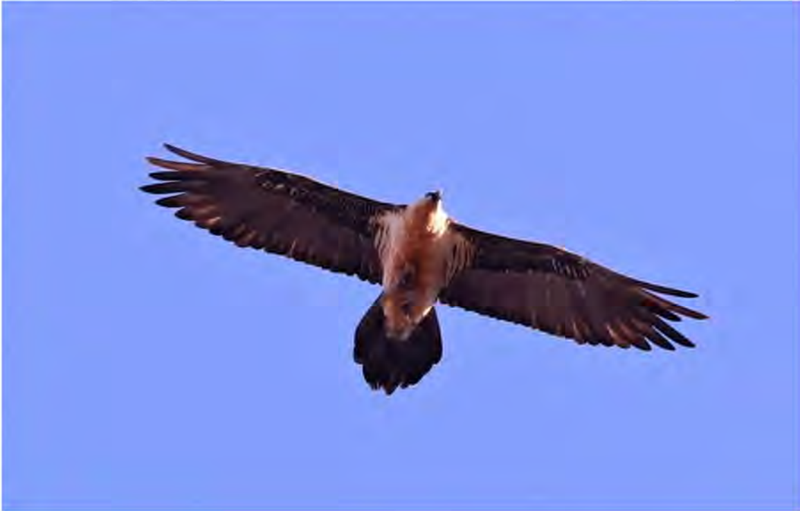
Lammegrib. Sierra de Guara.