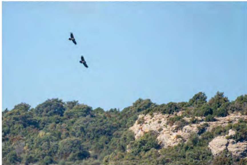
To unge lammegribbe. Santa Cilia.

En ungfugl af Lammegrib kom pludseligt glidende langs bjergvæggen, og den fik hurtigt følgeskab af to andre unge Lammegribbe . De tre store fugle lavede luftakrobatik med hinanden med fremstrakte kløer og landede senere på den skrå klippeflade ved fodringspladsen. En af dem fandt en knogle, som den fløj væk med, skarpt forfulgt af de to andre. En fantastisk opvisning!