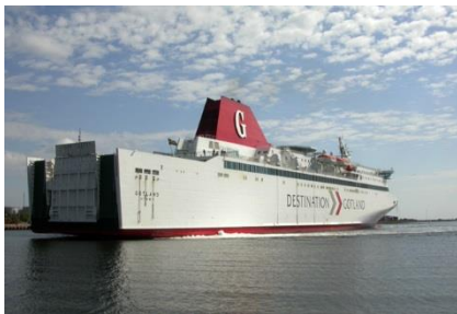
Færgen til Gotland

Vi mødes på Sjælør station ved middagstid. Herefter går turen via Øresundsbroen op gennem Sverige til havnebyen Oskarshamn, hvor færgen afgår til Gotland ca. kl. 21.00 Undervejs gør vi et længere ophold ved Galtsjön rastepuds Senere gør vi et ophold i Kalmar, hvor aftensmad m.m. kan købes. Herefter kører vi til Oskarshamn og sejler til Gotland. Sejliden tager ca. 3 timer, og her kan der købes aftenskafe m.m. Når vi ankommer til Gotland, skal vi videre til vores hotel, som ligger i Tofta 20 km syd for færgelejet i Visby.