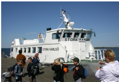
Båden til St. Karlsö

Vi skal på sejltur ud til St. Karlsö, som i dag er et naturreservat, og hvor bilkørsel ikke er tilladt. Her skal vi opleve et fuglefjeld med Nordeuropas svar på pingviner, de majestætiske alkefugle alk, lomvie og tejst. Alk og lomvie yngler på klippevægge, hvor de står tæt side om side på de smalle klippehylder, mens tejsten yngler i små klippehuller og ofte ses ligge på vandet. Langs kysten ligger de store edderfuglefamilier og passer deres unger, mens høgesangerens kraftige sang og karmindompappens fløjte høres fra skoven. Overalt på øen finder vi storslåede velbevaret natur.