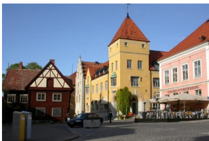
Torvet i Visby

Herefter besøger vi Visby og har en stor del af eftermiddagen til at opleve Gotlands "hovedstad" Visby, som var hansestad og centrum for al handel i Østersøområdet og er nordens mest velbevarede middelalderby med sine små hyggelige stenbelagte gader omkredset af den flotte bymur. I dag er den indre by erklæret verdensarv af UNESCO. I kan opleve Sct. Maria Domkirken, flere, Almedalen, hvor alle svenske politikere mødes en gang om året, eller blot slentre rundt på bymuren eller se på forretninger. Oplevelserne i Visby sker på egen hånd, så den enkelte kan prioritere tiden til de forskellige seværdigheder. Efter 3 timer i Visby fortsætter vi nogle fuglerige damme, hvor vi kan se den flotte Nordiske lappedykker.