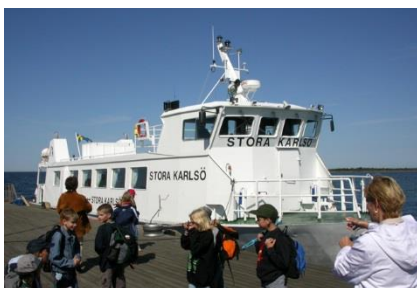
Båden til St. Karlsö

Vi skal på sejltur ud til St. Karlsö, som i dag er et naturreservat, og hvor bilkørsel ikke er tilladt. Her skal vi opleve et fuglefjeld med Nordeuropas svar på pingviner, de majestætiske alkefugle alk, lomvie og tejst. Alk og lomvie yngler på klippevægge, hvor de står tæt side om side på de smalle klippehylder, mens tejesten yngler i små klippehuller og ofte ses ligge på vandet. Langs kysten ligger de store edderfuglefamilier og passer deres unger, mens høgesangerens kraftige sang og karmindompappens fløjte høres fra skoven. Overalt på øen finder vi storslåede velbevaret natur.