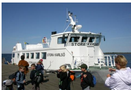
Båden til St. Karlsö

Vi skal på sejltur ud til St. Karlsö, som i dag er et naturreservat, og hvor bilkørsel ikke er tilladt. Her skal vi opleve et fuglefjeld med Nordeuropas svar på pingviner, de majestætiske alkefugle alk, lomvie og tejst. Alk og lomvie yngler på klippevægge, hvor de står tæt side om side på de smalle klippehylder, mens tejsten yngler i små klippehuller og ofte ses ligge på vandet. Langs kysten ligger de store edderfuglefamilier og passer deres unger, mens høgesangerens kraftige sang og karmindompappens fløjte høres fra skoven. Overalt på øen finder vi storslåede velbevaret natur.